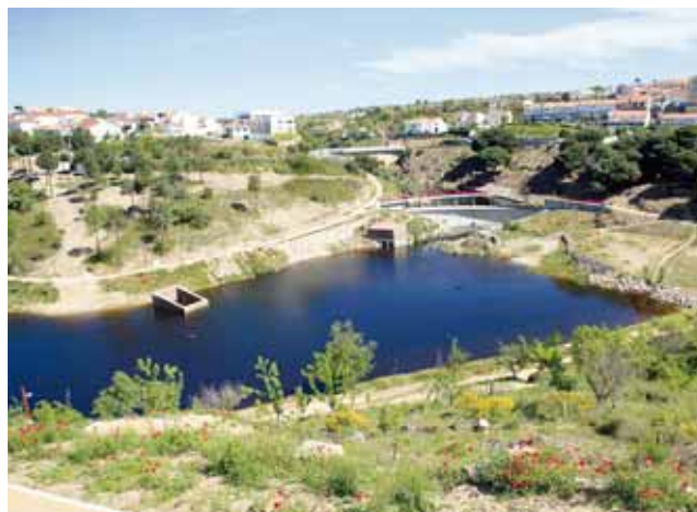
Avec son centre historique, la ville est tournée vers le fleuve Douro préservé par un parc naturel et l'Espagne que l'on rejoint en franchissant le cours d'eau par le sommet d'un barrage hydro-électrique.