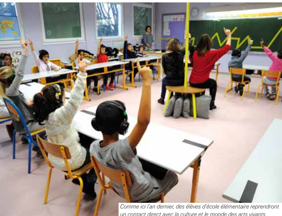
Comme ici l'an dernier, des élèves d'école élémentaire reprendront un contact direct avec la culture et le monde des arts vivants.

E n lien avec une classe de 6 e du collège Jules-Ferry d'Eaubonne et une classe de 1 er du lycée Camille-Claudel de Vauréal, les élèves de Bezons partent à la rencontre de l'équipe artistique Raphaël Cottin, Cie La Poétique des Signes, programmée au TPE durant la saison.