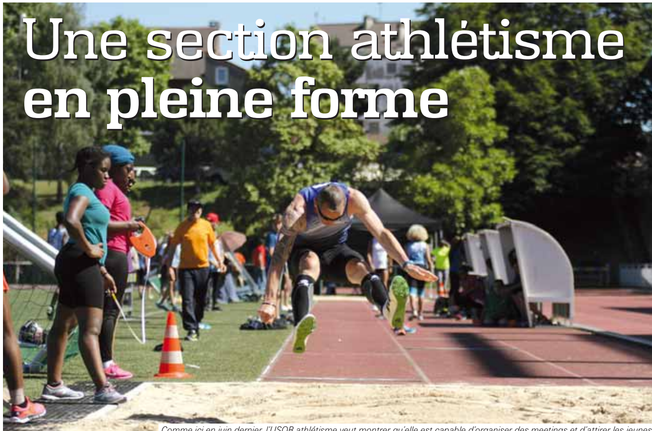
Comme ici en juin dernier, l'USOB athlétisme veut montrer qu'elle est capable d'organiser des meetings et d'attirer les jeunes.