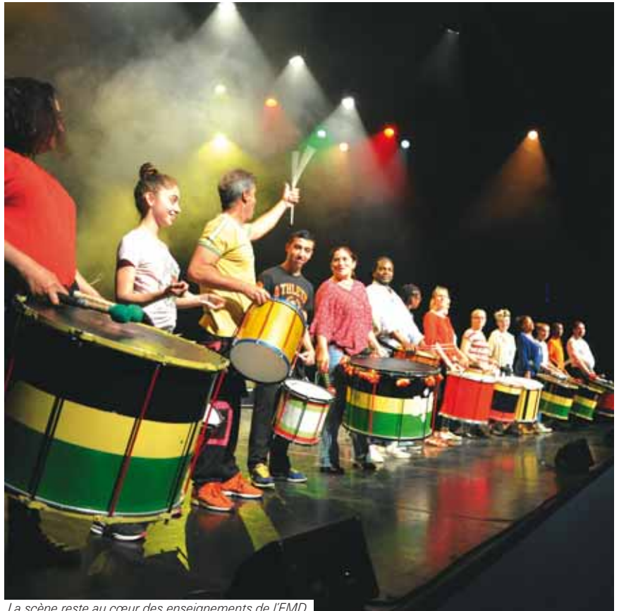
La scène reste au cœur des enseignements de l'EMD.

■ L'école de musique et de danse (EMD) fait une belle rentrée cette année avec plus d'une centaine de nouveaux inscrits dans les différentes pratiques.