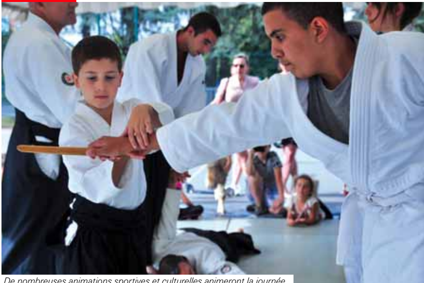
De nombreuses animations sportives et culturelles animeront la journée.