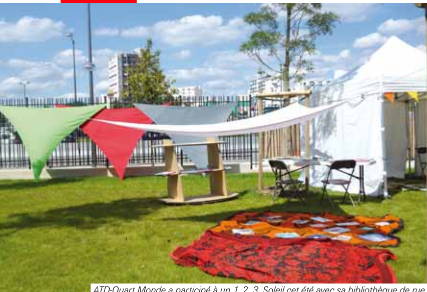
ATD-Quart Monde a participé à un 1, 2, 3, Soleil cet été avec sa bibliothèque de rue.