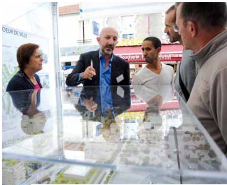
Sur le stand municipal, les élus présenteront les projets de la ville à la population.

• L'espace Zac « Bords-de-Seine » présentera le projet du Colombier (parking, logements, square, mail, démolition du parking silo), les nouveaux espaces verts (parc Mandela agrandi, square et mail Langlois), les nouveaux