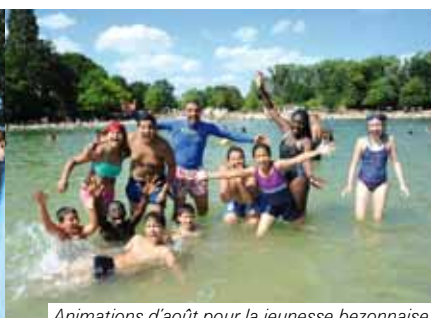
Animations d'août pour la jeunesse bezonnaise.