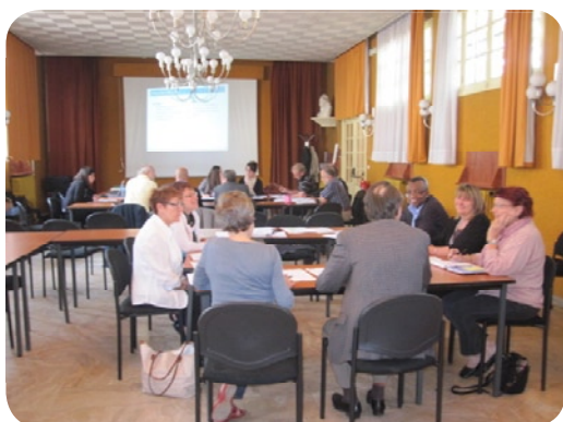
Séminaire des élus sur la stratégie – mai 2011

Leur travail a abouti à l'identification de 7 orientations stratégiques déclinées en 26 objectifs (cf. ci-dessous) qui permettent de fixer une ossature solide au programme d'actions.