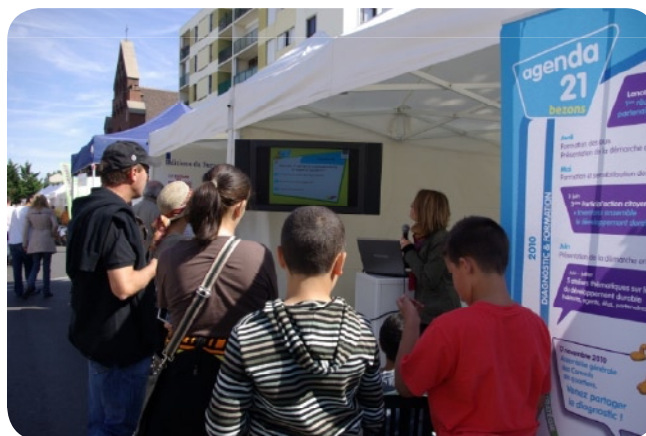
Foire de Bezons – Septembre 2010

De plus chacun des grands évènements organisés par la ville en 2010 comme la Foire de Bezons ou le Forum de la ville ont été l'occasion de sensibiliser les habitants au développement durable et leur expliquer ce que pouvait être un Agenda 21.