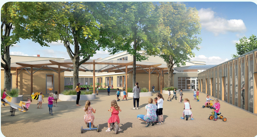
11 millions d'euros pour l'extension de l'école PVC

Pour accompagner l'arrivée de nouveaux élèves, qui n'avait pas été anticipée, nous avons ajouté des modulaires dans un premier temps et réalisé d'importants aménagements pour l'ouverture, en urgence, de plus d'une vingtaine de classes depuis 2020. Il est désormais nécessaire d'aller plus loin, en investissant dans des réalisations définitives pour répondre à l'attente des familles.