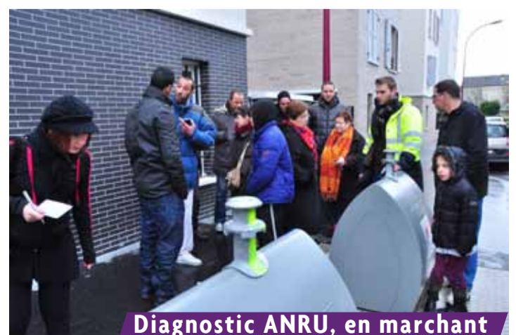
Diagnostic ANRU, en marchant